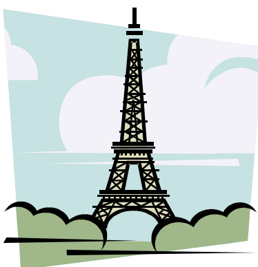
FIGURA 1 – TORRE EIFFEL, EM PARIS.